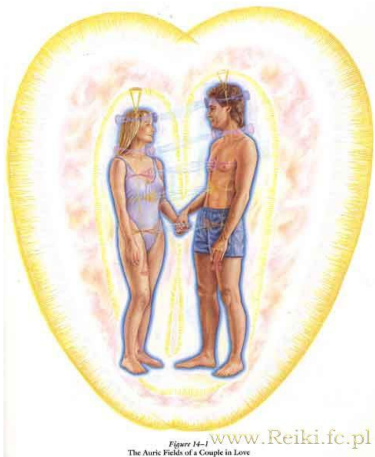
Figure 14-1 The Auric Fields of a Couple in Love

Poniższa ilustracja obrazuje, jak wygląda ludzka aura dwóch zakochanych osób.